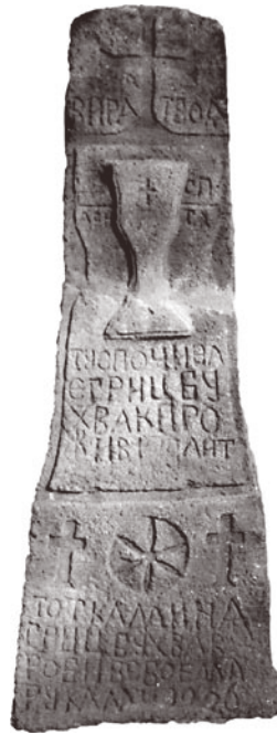
Nagrobek Hrycia Buchwaka – front (opis na s. 2)