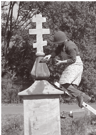
Piaskowcowa kapliczka z 1909 r. Grab, gm. Krempna. Prace remontowe w VIII i IX 2007 r.

Naturalną kontynuacją prac NADSANIA i NGK MAGURYCZ jest działalność powołanego w XII 2006 r. i zarejestrowanego w III 2007 r. STOWARZYSZENIA MAGURYCZ. Poza pracami remontowymi stowarzyszenie podejmuje różne inne działania na rzecz dziedzictwa kulturowego – prowadzi warsztaty i inwentaryzacje, organizuje wystawy i wspiera inne podmioty – a także zaangażowało się w ochronę przyrody.