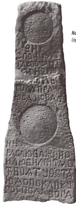
Nagrobek Hrycia Buchwaka – tył (opis na s. 2)