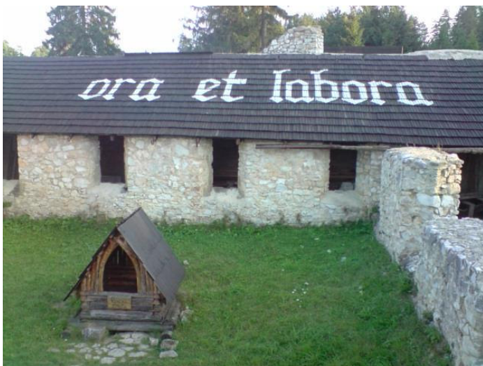
Fot. 2 Maksyma na jednym z dachów zrekonstruowanego obiektu.