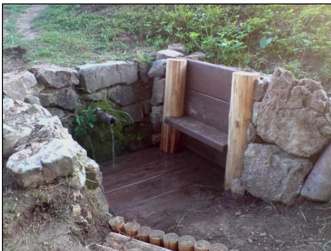
Fot. 3 Przyklasztorne źródelko.