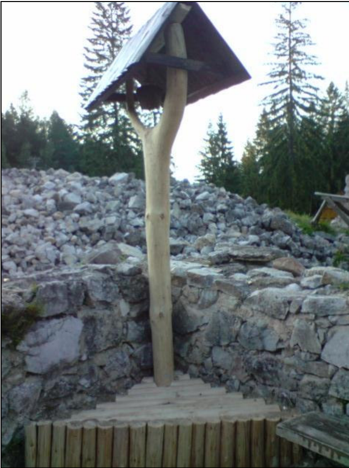
Fot. 4 Dzwonniczka, służąca do zwoływania apelu.